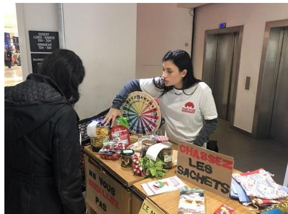
FNE Provence Alpes Côte d'Azur, 2019

Nos choix de consommation dépendent de multiples facteurs, dont bien souvent notre pouvoir d'achat et la force de l'habitude. Ainsi, mieux vaut éviter une approche culpabilisatrice, généralement contre-productrice, mais au contraire mettre en avant les économies réalisables et la facilité du geste. Pour illustrer cela, n'hésitez pas à présenter des exemples concrets de suremballage d'un côté, et d'alternative durables de l'autre. Une équivalence durée d'usage / coût est un must !