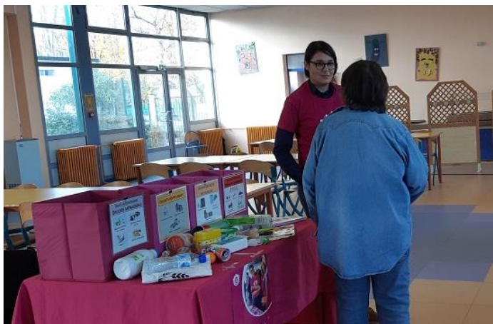
Jeu du Tri, PikPik Environnement, 2019

En mettant en scène des objets à placer dans les « bonnes poubelles », vous pourrez proposer des cas pratiques pour faire (re)découvrir les consignes en vigueur, et lever les doutes existant sur certains objets du quotidien. De plus, vous pouvez étendre votre champ à d'autres types de déchets : textile, piles, déchets électriques et électroniques, déchets alimentaires, etc... Plus efficace qu'un long discours !